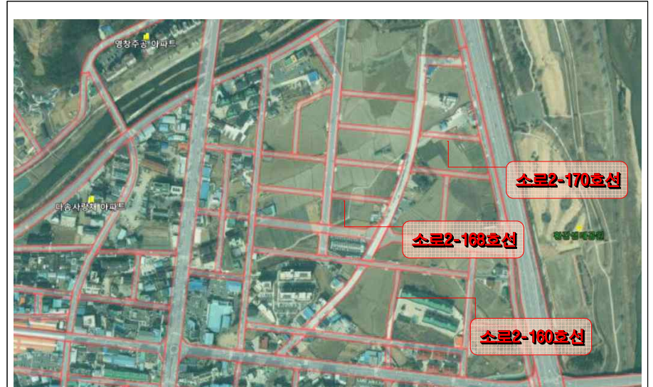
햇들 도시계획도로 개설 위치도