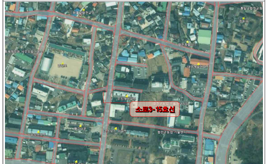
창동(소로3-15호선) 도시계획도로 개설 위치도